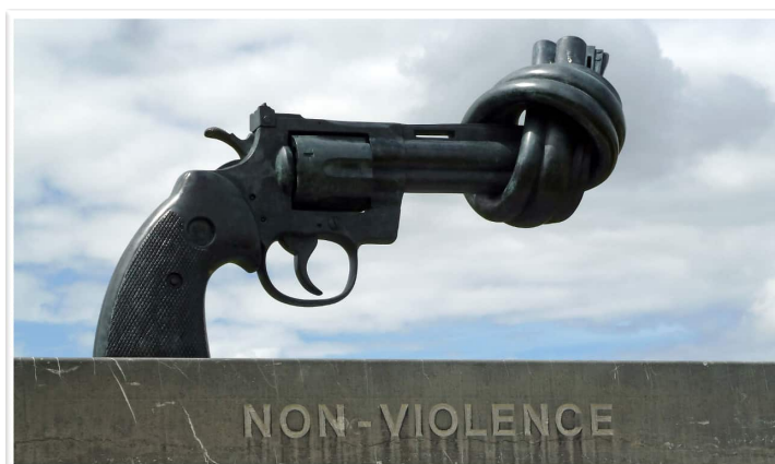
Le « Révolver noué », « Knotted Gun » de Carl Frederik Reuterswård.